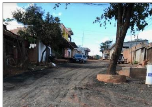
Figura 3: Lançamento de material frisado em via, Ocupação Rosa Leão

As ações também incluíram o acompanhamento social e o encaminhamento das famílias para os programas de acolhimento provisório, como o Bolsa Moradia e o Programa de Abono Pecuniário Habitacional.