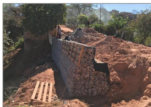
Figura 4: Implantação de contenção tipo gabião, Ocupação Rosa Leão

A interação com a população das ocupações da Região da Izidora leva em conta a organização prévia à constituição do CREURB, que conta com a coordenação dos movimentos de luta por moradia que impulsionaram a ocupação.